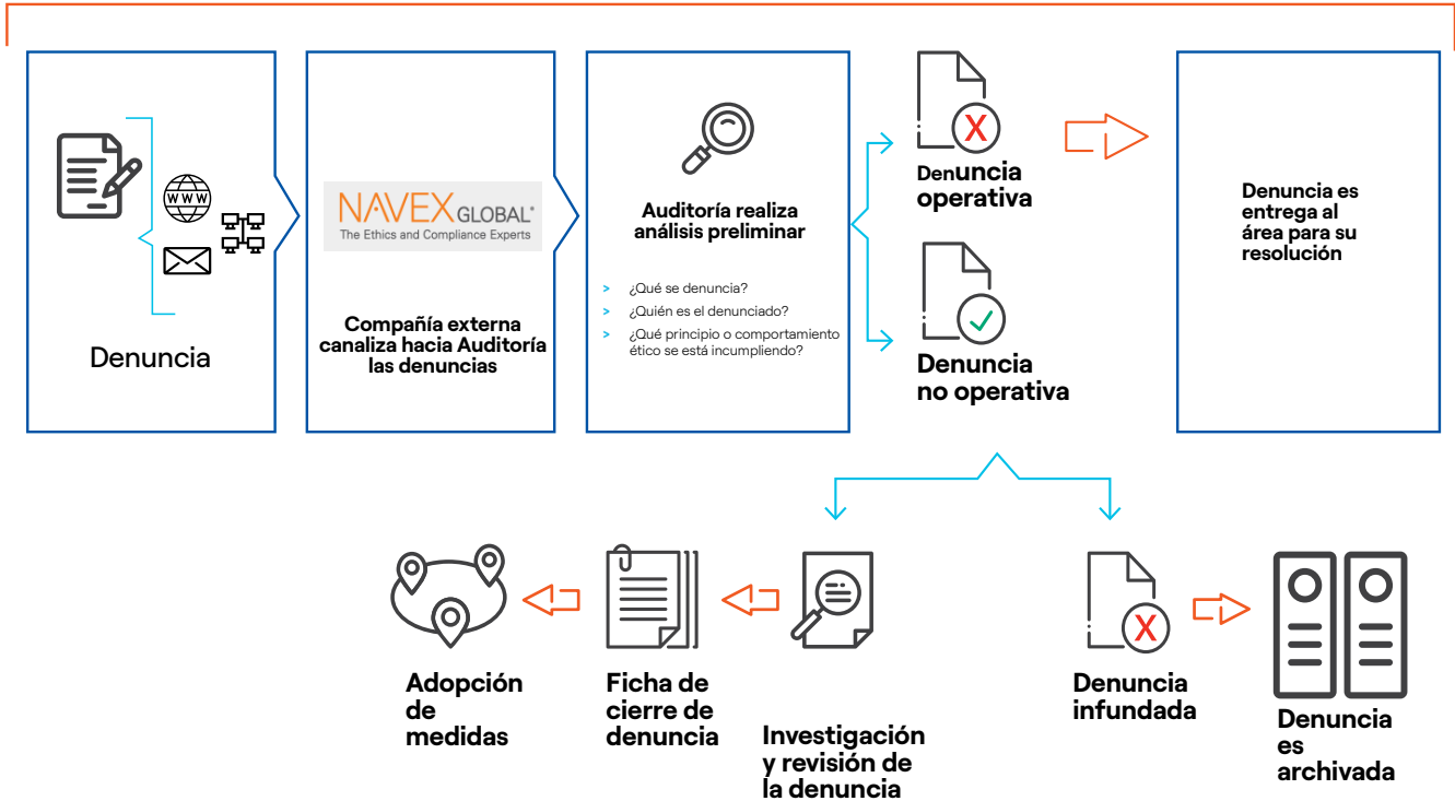
Funcionamiento del Canal Ético