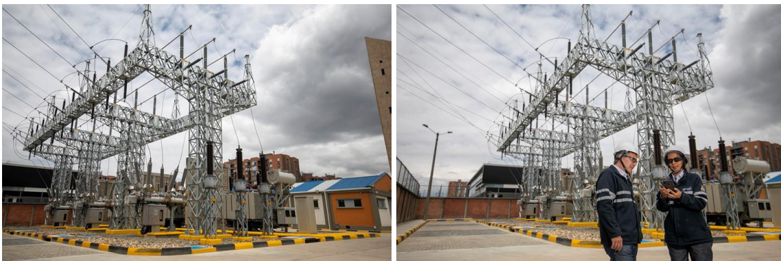
Fotografías de la Subestación Morato al norte de Bogotá, luego de ser modernizada y ampliada con equipos de última tecnología

Los trabajos realizados consistieron en el cambio y actualización tecnológica de diferentes elementos de la subestación, tanto de potencia, como de protección y control. De este modo, se incorporaron equipos de última tecnología y con los más altos estándares internacionales.